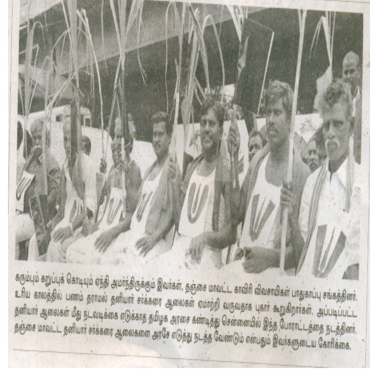
(தினமலர் திருச்சி 8.8.2013 இதழில் வெளிவந்த புகைப்படம்)

ஒரு மாறுதலுக்கு, சிலுவையை அணிந்து கொள்ளுங்கள். அல்லது 786 இலக்கமிட்ட குல்லாவை அணிந்து கொண்டு லுங்கியைக் கட்டிக் கொண்டு போராட்டத்தில் ஈடுபடுங்களேன். ஏமாற்றப்பட்டு விட்டோம் என்பதற்கு எந்த அகராதியில் நாமத்தை போட்டுக் கொள்ள வேண்டும் என்று உள்ளது. அப்படியானால் தினந்தோறும் பன்னிரண்டு நாமங்களைத் தரித்து கொள்ளும் தூய வைணவர்கள் எல்லோரும் ஏமாற்று பேர்வழிகளா? திருமலையப்பன் மிகப்பெரிய ஏமாற்று பேர்வழியா? ஏன் லட்சக்கணக்கில் மக்கள் திருமலைக்குச் செல்கிறார்கள். அந்த தெய்வம் ஏதோ வரந்தரும் என்னும் நினைப்பில்தானே. புரட்டாசி மாதம் வந்தால் வைணவக் கோயில்களில் மக்கள் அதிக அளவில் கூடுவதேன்? வாழ்நாள் முழுவதும் நாஸ்திகம் பேசி வந்தவனைக் கூட சுடுகாட்டிற்கோ அல்லது இடுகாட்டிற்கோ எடுத்துச் செல்லும்போது அவன் நெற்றியிலே நாமம் இடப்படுகிறது. நாமம் என்ற சொல்லுக்கு எம்பெருமானுடைய பன்னிரண்டு திருநாமங்களைச் சொல்லி இடப்படும் ஒரு குறியீடு என்பது பொருளாகும். கோவிந்தா கோவிந்தா என்று சொல்வதும் இதைப் போலத்தான். இவ்வுலகிலுள்ள அனைத்துச் செல்வமும் இறந்து போனவனுடைய ஆவியும் கோவிந்தனுக்கே சொந்தம் என்பதை கோவிந்தா கோவிந்தா என்ற முழக்கம் வெளிப்படுத்துகிறது.